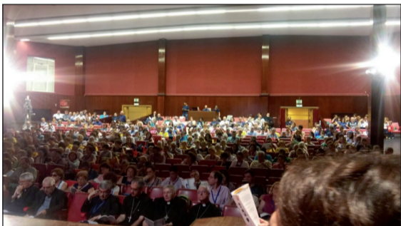
Una de las sesiones celebradas.