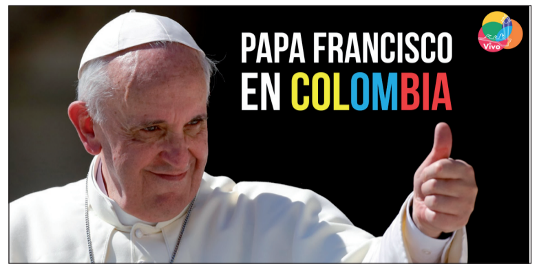
Uno de los carteles que anuncian la visita y que adornan las calles de Colombia durante estos días.

La Conferencia Episcopal de Colombia (CEC) y el Comité Ejecutivo para la visita apostólica han habilitado un call center que funcionará las 24 horas del día para dar información de primera mano a los fieles sobre todo aquello que concierne a las actividades que realizará el Papa.