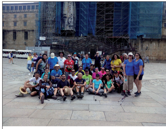
Peregrinos a la llegada a Santiago.