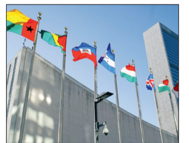
Sede de la ONU en Nueva York.

Es necesario por ello sensibilizar; defender la libertad religiosa y protestar cuando se viola; una colaboración entre Iglesia y Estado para defenderla sin confundir los roles; que los líderes religiosos condenen la violencia y el terrorismo contra otras religiones; que el diálogo interreligioso sea antidoto a la violencia; una sólida educación religiosa para prevenir la radicalización que lleva al extremismo; y bloquear el flujo de dinero y las armas destinadas a aquellos que pretenden utilizarlos para atacar a las minorías religiosas. Zenit