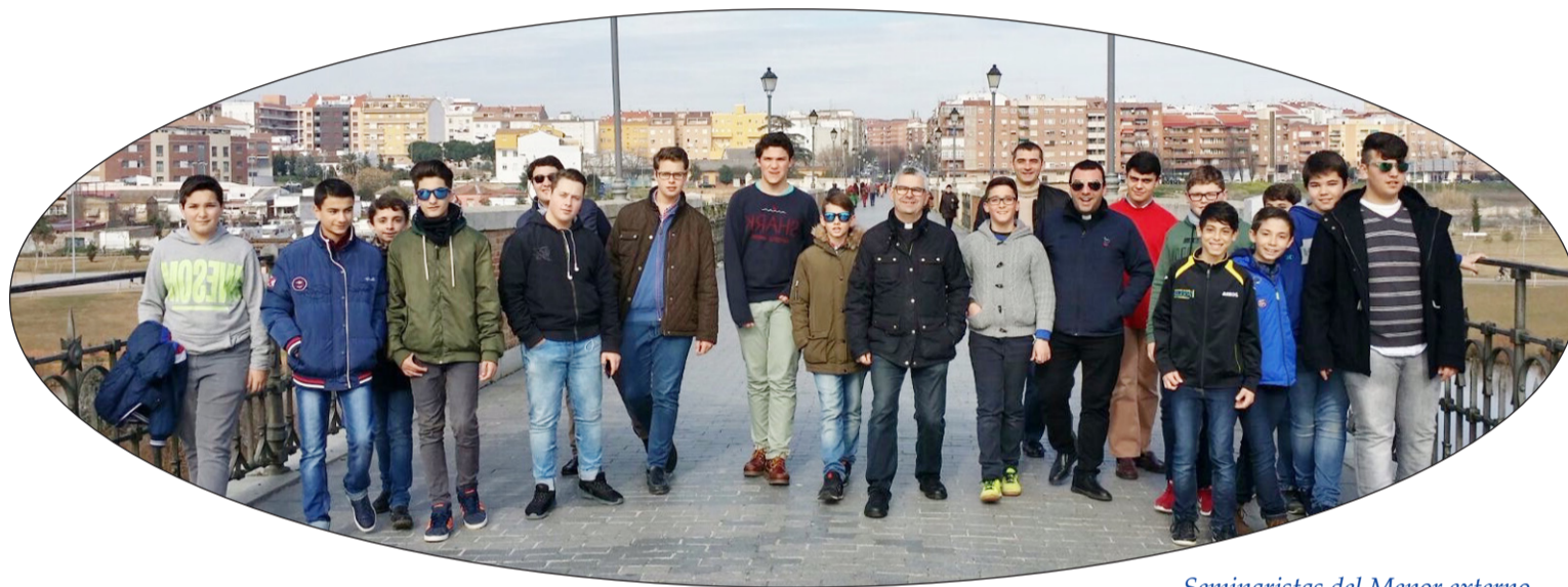
Seminaristas del Menor externo junto a los formadores.

Campamento de verano en Solana de Ávila (Ávila).