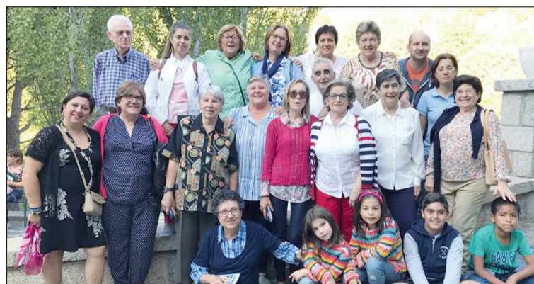
Participantes de Mérida-Badajoz en las Jornadas.