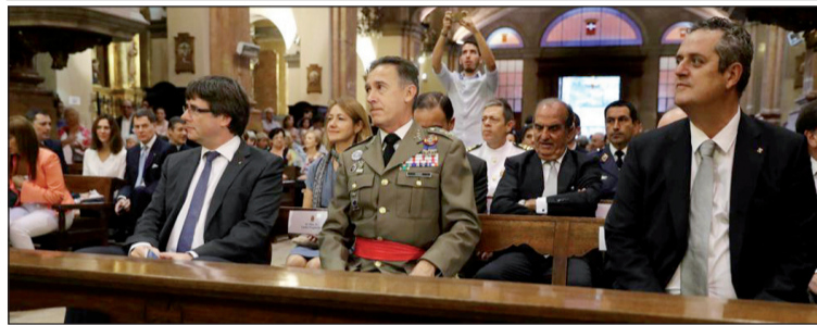
Arriba, Monseñor Juan José Omella. Abajo, las autoridades.

abandona al pueblo que confía en Él", aseguró Monseñor Omella, que ve conmovedor ver a personas que no pierden la esperanza y tienen ilusión ante dificultades y penalidades, porque las mantiene firmes y con dignidad.