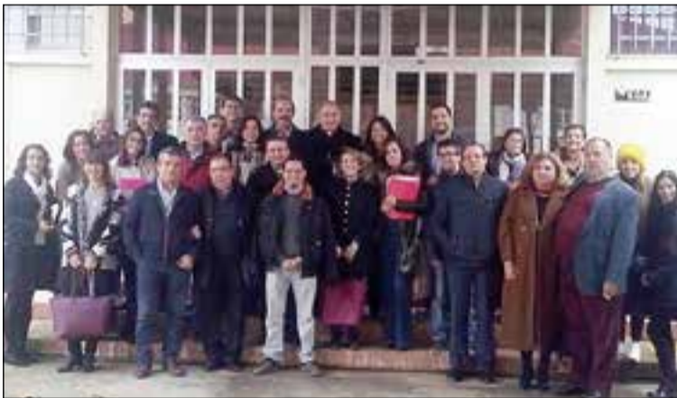
Asistentes al homenaje a la Inmaculada en la UEx.

Al concluir el acto, la visita continuó compartiendo una