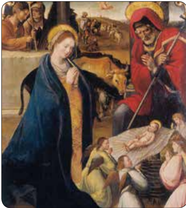
Nacimiento de Jesús. Anónimo sevillano (Hacia 1540). Capilla Santa Ana (Catedral de Badajoz)

El nacimiento de Jesús marca toda una civili-