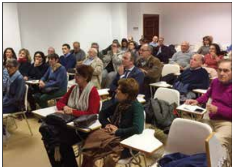
Socios y donantes que participaron en el encuentro.

Este tipo de encuentros promueve un acercamiento y un rendir cuentas con las personas que de alguna manera sueñan un mundo más justo y solidario.