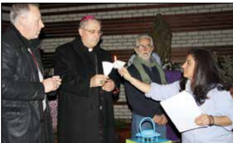
El Arzobispo presidió la celebración.