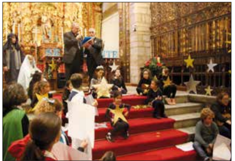
El Arzobispo felicitó la Navidad a los niños que participaron.

El Grupo de animadores Misioneros de la Diócesis, que se reúne todos los meses, ha celebrado el pasado sábado un retiro de adviento en la parroquia San Pedro de Alcántara de Badajoz, en la barriada de Suerte de Saavedra.