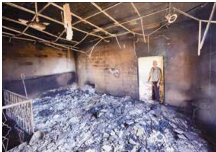
Cristiano observando su casa arrasada por el Daesh.

La Fundación de la Santa Sede Ayuda a la Iglesia Necesitada (ACN España) lan-