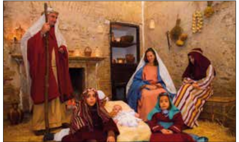
Bandas, y Corales que darán su año, los coros participantes recital en la Parroquia. Tras cantan al Portal. su actuación y, como cada

El día 30, se celebra además la VIII Convivencia de Coros,