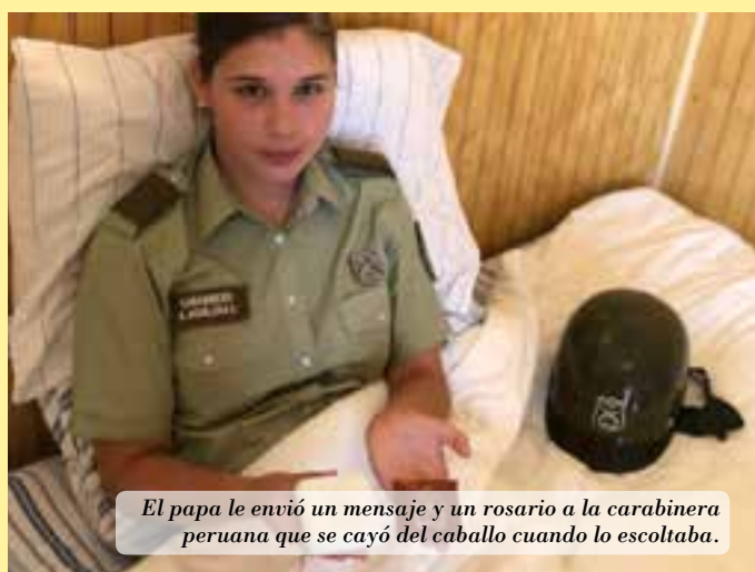
El papa le envió un mensaje y un rosario a la carabinera peruana que se cayó del caballo cuando lo escoltaba.