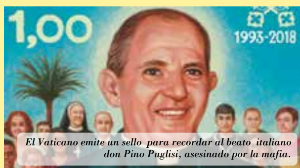
El Vaticano emite un sello para recordar al beato italiano don Pino Puglisi, asesinado por la mafia.