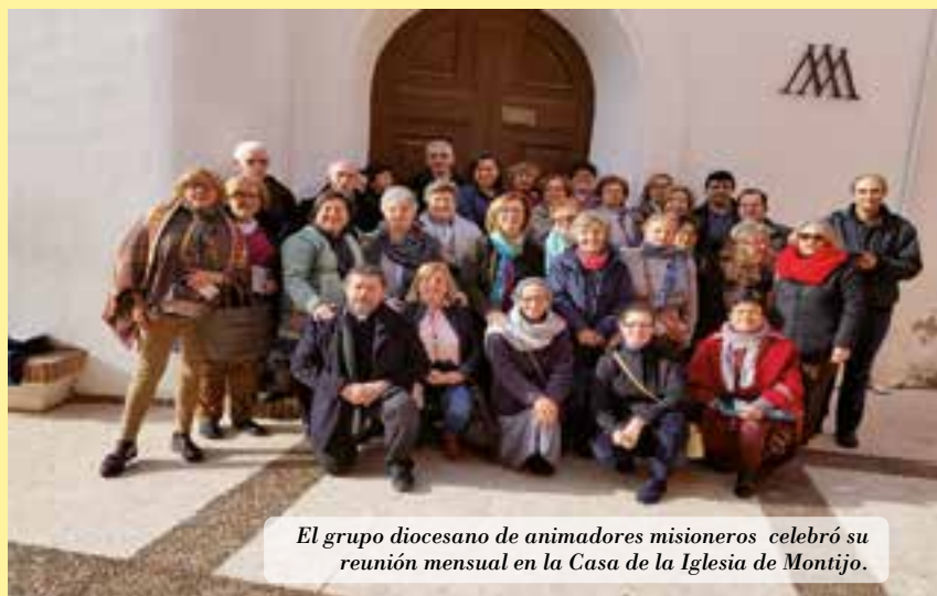
El grupo diocesano de animadores misioneros celebró su reunión mensual en la Casa de la Iglesia de Montijo.