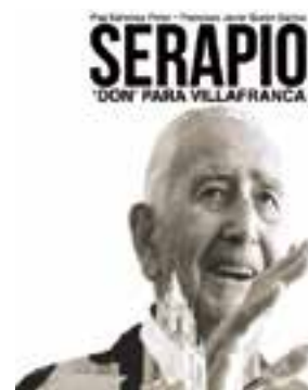
Portada del libro.