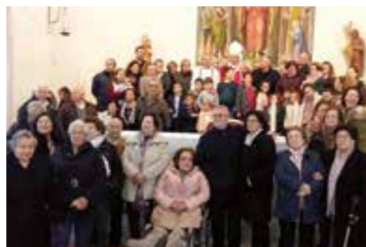
Arriba, el Arzobispo rezó un responso en el cementerio de Gadiana. En la foto de abajo, con la comunidad de Alcazaba.