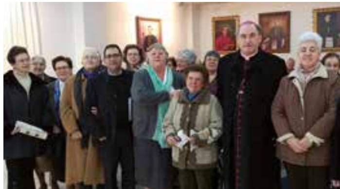
Encuentro del Arzobispo con religiosas de la diócesis.