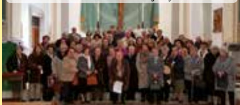
Vida Ascendente celebró el día 2 a sus santos patronos con una eucaristía en la parroquia de San Juan Bautista de Badajoz y una comida.