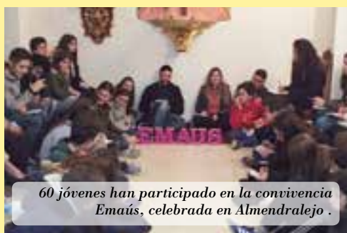
60 jóvenes han participado en la convivencia Emaús, celebrada en Almendralejo.