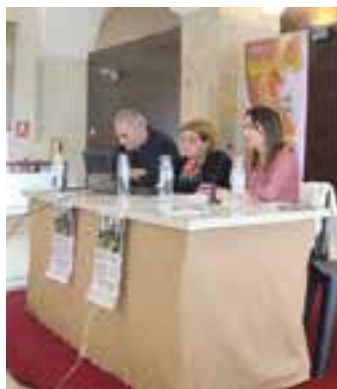
Presentación del Proyecto que tendrá presencia en Badajoz, Mérida, Villanueva y Azuaga.

Spei Mater es una asociación de defensa de la vida en la Iglesia, y nació con el convencimiento y necesidad de dar respuesta a la cultura de la muerte como católicos, desde el evangelio y como iglesia. Se ponen al servicio de las diócesis para dar respuestas concretas mediante sus proyectos. Están presentes en más de 30 diócesis en