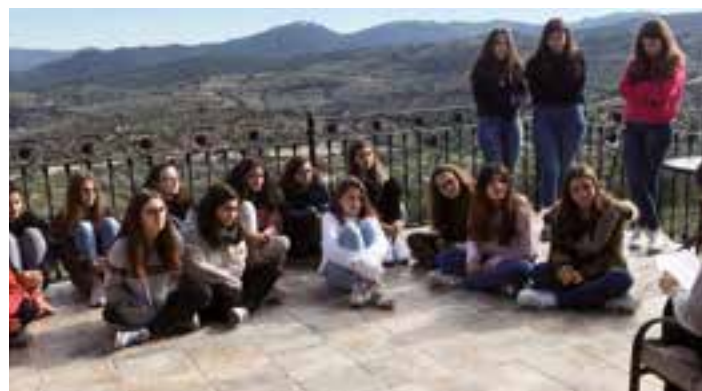
Algunas de las participantes del proyecto "Siquem".

El proyecto "Siquem" está dirigido a chicas de 2º y 3º de la ESO, tiene una duración de dos años y en él, a diferencia de "Pozo de Jacob", se trabaja el acompañamiento de forma grupal