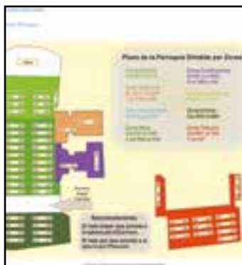
Plano del templo para reservar asiento.