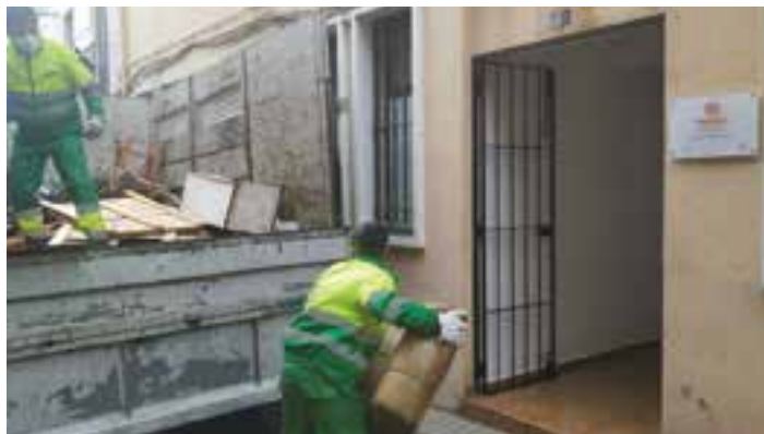
Operarios del Ayuntamiento han adecuando las instalaciones durante esta semana.

En un primer momento acogerá a las personas procedentes del pabellón "Las Palmeras", habilitado desde el pasado 22 de marzo y que se cerrará el lunes. Aunque contará con 20 plazas, acogerá a 15 personas del medio centenar que estaban en el pabellón, el resto, 14 personas, se reubicarán en el Centro Hermano de Badajoz y 5