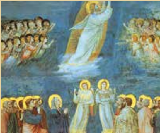
Ascensión de Jesús, de Giotto

Y sabed que yo estoy con vosotros todos los días, hasta el final de los tiempos».