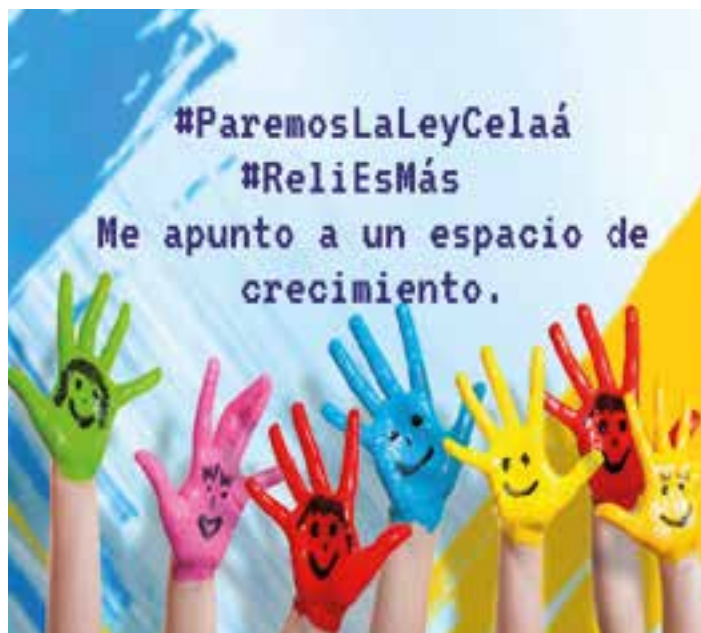
Una de las imágenes utilizadas en las quedadas digitales en Twitter.