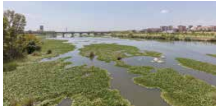
El río Guadiana, a su paso por Badajoz.

En dicho comunicado se unen "al inmenso dolor de los familiares y allegados a estos trabajadores", además,