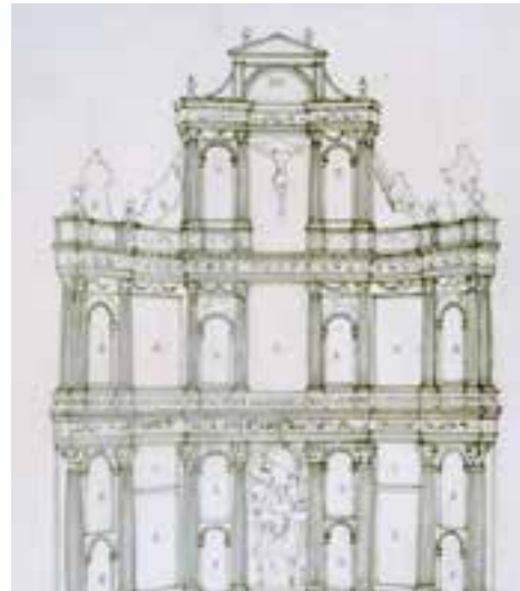
Retablo de la parroquia de Ntra. Sra. de la Purificación y San Pedro. Almendralejo. A la derecha el boceto, tomado de "Retablistica de la Baja Extremadura".

mendralejo. Fue concertado junto con dos colaterales en