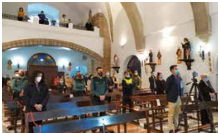
Eucaristía en la parroquia de Valverde de Leganés con las restricciones marcadas por las autoridades sanitarias

En estas circunstancias, el arzobispo metropolitano de Mérida-Badajoz, el obispo de Plasencia y el Administrador Diocesano de Coria-Cáceres queremos compartir con todos la gran preocupación y zozobra que