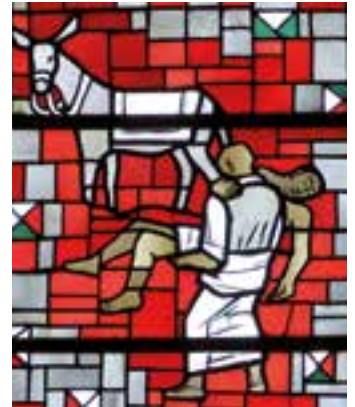
El capítulo segundo de la “ Fratelli Tutti ” se centra en la parábola del Buen Samaritano.

Aquellas personas que lo deseen pueden encontrar el texto en la página web de la archidiócesis: meridabadoj.az.net .