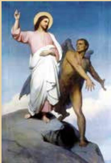
La Tentación de Jesús, de Ary Scheffer. Walker Art Gallery (Liverpool).

- «Se ha cumplido el tiempo y está cerca el reino de Dios. Convertíos y creed en el Evangelio».