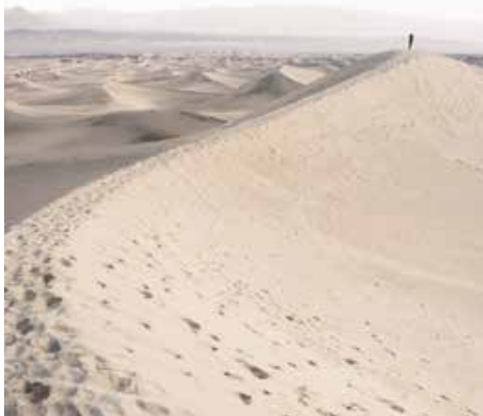
En el evangelio del I domingo de Cuaresma, Jesús permanece fiel en el desierto.

Como en toda acción litúrgica, hay dos mesas, íntimamente unidas, pero una precede a la otra. La de la Palabra culmina en la mesa del Sacramento. En Cuaresma estas lecturas de la Escritura santa se han elegido con exquisito detalle, de modo que la asamblea medite y saboree las abundantes delicias de la palabra divina. Estamos en el Año B del ciclo dominical, pero siempre podemos escoger las lecturas del ciclo