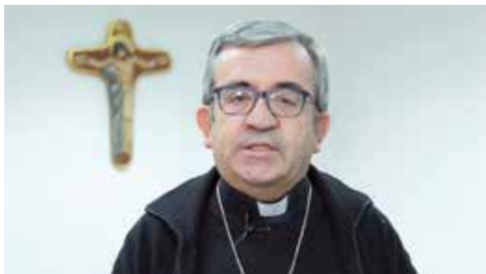
Mons. Argüello, en el mensaje hecho público sobre las inmatriculaciones.

existían dos años después de cada acto inmatriculado para que personas con mejor derecho o instituciones pudieran reclamar la titularidad de esos bienes. En todo caso, la Iglesia no quiere que esté a su nombre nada que no sea suyo, por eso si alguien viniese con mejor derecho y que pudiera revisar la inmatriculación realizada, cada institución de la Iglesia que