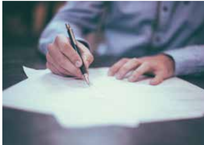
En 1863 se creó en España el Registro de la Propiedad.

La Iglesia llegó a la península Ibérica en el siglo I. Durante siglos, el Pueblo de Dios fue construyendo lugares de culto, templos, parroquias o basílicas. Con la organización en diócesis fueron construyéndose las catedrales, y con la aparición de las órdenes religiosas comenzaron los monasterios, abadías y cenobios. Según crecía su presencia surgieron rectorías y seminarios, y la Iglesia recibía donaciones de tierras, fincas, etc. para el sustento