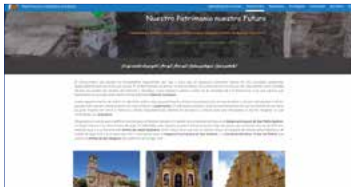
Web que recoge este proyecto.

Los alumnos de 2º de Bachillerato que cursan la asignatura de Religión en el IES Vegas Bajas de Montijo han iniciado un proyecto basado en el sistema "Aprendizaje por servicio" que va dirigido a conocer, difundir y proteger el Patrimonio Histórico-artístico de Montijo y su comarca bajo el título "Nuestro Patrimonio: nuestro futuro". Siguen, en una primera fase, tres líneas de actuación: el conjunto arqueológico de la villa romana de Torreáguila del siglo I (orígenes de