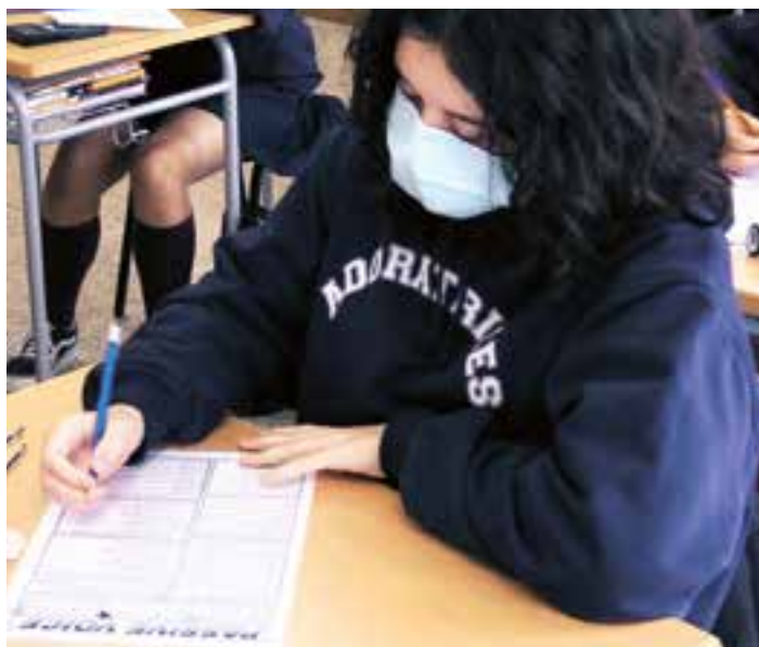
Alumna del colegio Adoratrices, de Logroño.

Los padres son los encargados de educar para la vida, de enseñar los rudimentos de una profesión, de transmitir las costumbres del pueblo. Son los primeros protagonistas de la educación de sus hijos y esa educación es su primera misión y responsabilidad. Cuando la familia no educa, toda la