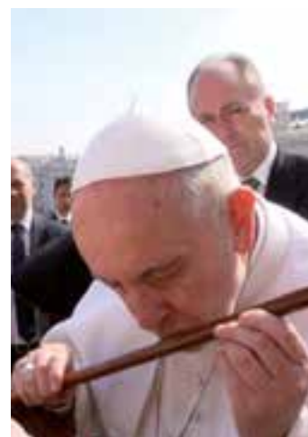
El Papa Francisco besa el bastón de santa Teresa.

cisco destacó la gran devoción que Santa Teresa tenía por san José.