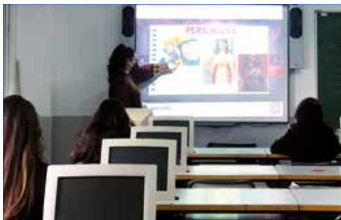
Dos momentos de la clase de Religión.

tenemos a un gran número de personas a las que seguimos y que nos siguen, un lugar donde se destaca el hecho de que mientras más seguidores y likes tengas, más influencia tienes sobre los demás”.