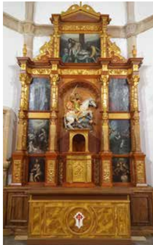
Retablo mayor de la parroquia Santiago Apóstol de Torremayor tras la restauración a la que ha sido sometido.

Además de este retablo, el templo guarda entre sus maravillas artísticas algunos ejemplos de la belleza de su patrimonio, como por ejemplo su pequeña ventana mudéjar en el lado izquierdo junto al ábside, la propia puerta de la torre de sobrio estilo del siglo XVI o el labrado sagrario, según informa el profesor Pablo Iglesias.