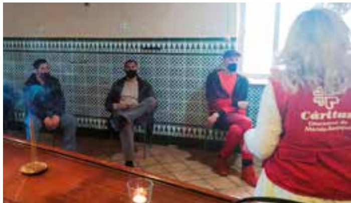
Voluntaria atendiendo a personas que venían de la calle.

Pudo ponerse en funcionamiento gracias a la financiación de la Junta y el trabajo en coordinación de Cáritas Diocesana de Mérida-Badajoz y Cáritas Arciprestal de Mérida