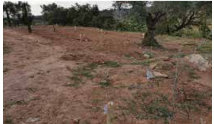
Olivos sembrados en el huerto del ermitaño.