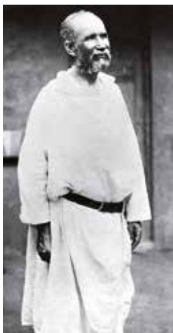
Última fotografía en vida de Charles de Foucauld.

El más conocido de este grupo de nuevos santos es Carlos de Foucauld, religioso francés beatificado en 2005 por el papa Benedicto XVI. Noble (era vizconde de Pontbriand), originario de Estrasburgo, después de una vida agitada como soldado y explorador en África y de varias aventuras amorosas, a principios de 1889 en Nazaret comprendió la necesidad de cambiar su vida. Su conversión lo llevó primero a entrar en un comedor social, y