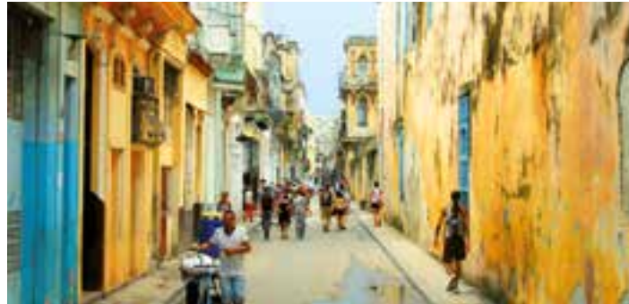
Calle de La Habana (Cuba).

En Cuba hay “falta de confianza y libertad para expresarse”, pues en la gran mayoría del pueblo “existe miedo a la exclusión”, indicó la carta de la Conferencia Cubana de Religiosos de Camagüey (CONCUR Camagüey), entregada a las autoridades en un encuentro que sostuvo-