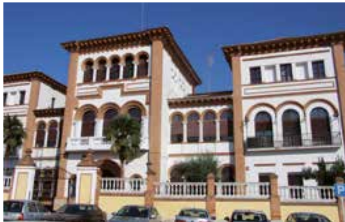
En el Plan se recoge la elaboración de un plan diocesano para las vocaciones sacerdotales.

Para que tanto el objetivo general como los espe-