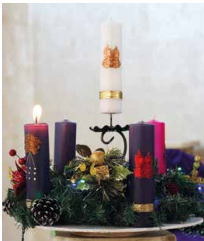
Una corona de Adviento.

El círculo es una figura geométrica que no tiene ni principio ni fin. La Corona de Adviento recuerda que Dios tampoco tiene principio ni fin, por lo que refleja su unidad y eternidad. Es