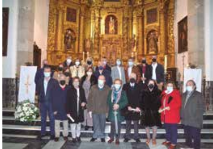
Matrimonios que celebran sus bodas de oro y plata.

Cada pareja subió al altar a testimoniar, de nuevo, el