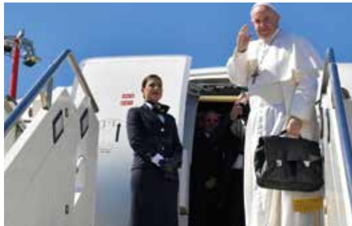
El papa Francisco antes de realizar un viaje apostólico..

Papa que visita Malta. El primero fue Juan Pablo II, que viajó en dos ocasiones, la última en 2001 para beatificar a don Gorg Preca, el primer santo maltés; a sor