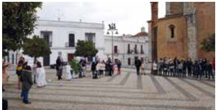
Suelta de globos en la plaza de España en Los Santos de Maimona.

En el acto, que contó con numeroso público, se recaudaron en torno a 1.400 €, que irán destinados a financiar proyectos de