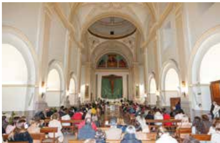
Eucaristía en la parroquia San Juan Bautista.