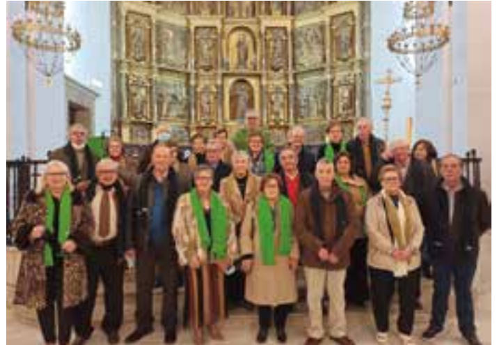
Grupo de matrimonios que celebró Bodas de Oro.