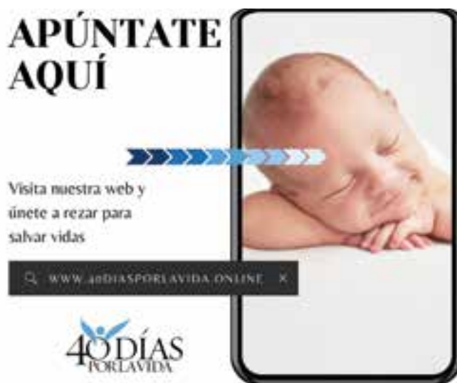
Imagen de la campaña.

“40 Días por la Vida” ya ha generado resultados sin precedentes en la lucha por