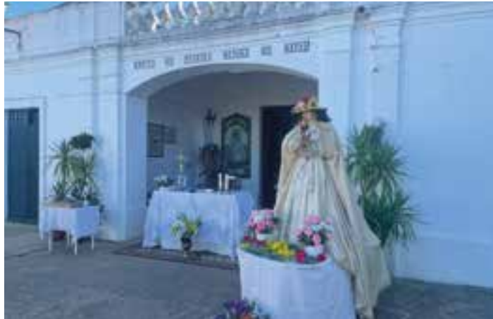
La Virgen de Bótoa durante una eucaristía de petición por la lluvia.

En el decreto se dirige especialmente a los sacerdotes, a los que les solicita que “celebren en alguna ocasión la Misa ‘ad petendam pluviam’ (Misal Romano, p. 1049), y también se tenga presente en la oración de los fieles. Hemos de encomendar también al Señor esta intención en las preces de Laudes y Vísperas, en la exposición y adoración del Santísimo y en cualquier otro tipo de oración comunitaria que se celebre en nuestra Archidiócesis”.