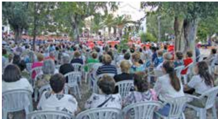
Arriba, D. José entregó a la Virgen un rosario y una cruz pectoral. Abajo, numerosos fieles participaron en la Eucaristía.

vila. Antes de comenzar la Eucaristía descubrió una placa conmemorativa de este día.