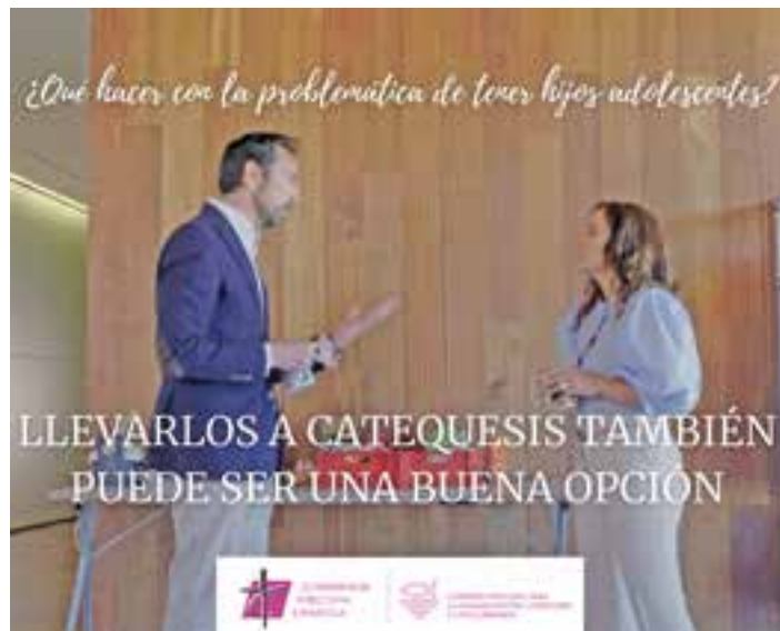
Imagen de la campaña "Apunta a tus hijos a catequesis"

Este es el interrogante que lanzan desde la Comisión Episcopal para la Evangelización, Catequesis y Catecumenado en el vídeo con el que quieren despertar "la