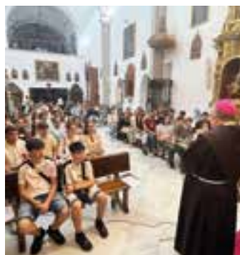
D. José habló a los jóvenes.

Por otro lado, el Seminario Diocesano "San Atón" acogió una convivencia vocacional. Comenzó el viernes con la participación en la vigilia de oración. Ya el sábado los participantes peregrinaron a la basílica Santa Eulalia, en Mérida, junto a sus familiares, para ganar el jubileo en el