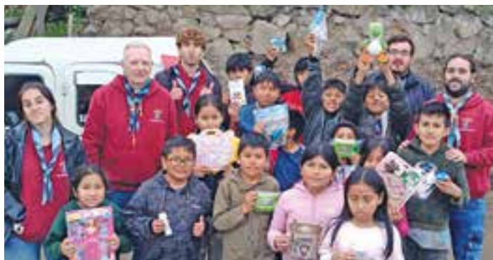
Jóvenes de Puebla de la Calzada, con niños peruanos.