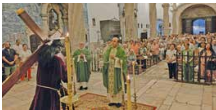
El Señor de los Pasos ocupó la nave central del templo con motivo de la Eucaristía de Acción de Gracias por este aniversario.

La Archicofradía del Señor de los Pasos de Olivenza celebraba recientemente los 445 años de su fundación. Para conocer la historia de esta cofradía hay que remontarse al año 1579; por entonces nació la "Congregación de las Chagas de Nosso Senhor Jesucristo" (recordamos que en aquellos momentos Olivenza era localidad portuguesa). El 14 septiembre de ese año, tras la petición realizada por 150 hombres de campo, el obispo de Elvas autorizó fundar una Agrupación dedicada a las Llagas de Cristo; esta Agrupación tomó este nombre en honor a un Crucificado que se ve-