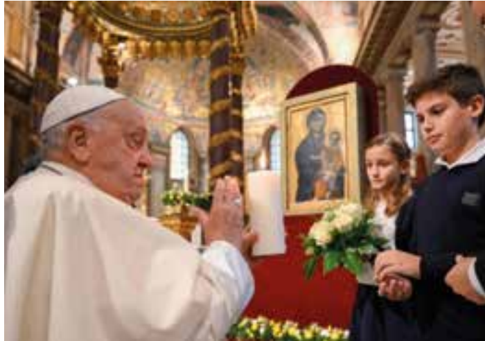
El Papa asistió al rezo del Santo Rosario para invocar la paz en la basílica Santa María la Mayor.

Ya la víspera, el domingo, Francisco se unió, en la basílica Santa María la Mayor de Roma, a los miembros del Sínodo de los Obispos y a los fieles de todo el mundo para rezar el rosario en súplica del don de la paz en el mundo por intercesión de la Virgen. "¡Acoge nuestro grito!", rezó el Papa, pidiendo también una "mirada materna sobre la familia humana". El mismo lunes, día de la Virgen del Rosario, el Papa les dirigió una carta a los católicos de Oriente Medio denunciando el conflicto, pero sobre todo expresando su cercanía a todos los creyentes que sufren por la guerra: "La mecha del odio que estalló hace un año no se ha apagado. Es vergonzosa la in-