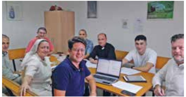
Miembros de la Secretaría General de las Asambleas Diocesanas.

El pasado sábado se reunieron en la parroquia Ntra. Sra. de los Milagros, en Mérida, con el objetivo de poner en marcha las Asambleas Diocesanas, que anunció el Arzobispo de Mérida-Badajoz el pasado 2 de septiembre. La primera fase durará hasta el próximo mes de diciembre y será un trabajo previo que se llevará a cabo en las parroquias, grupos, colegios, movimientos, asociaciones, casas de religiosos... Para ello se pedirá a los miembros de