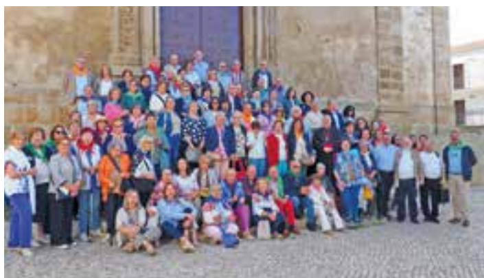
Participantes en la ultreya diocesana con el Arzobispo.

Los nuevos horarios del Santuario son los siguientes: misa los jueves y sábados a las 19:00 h., y domingos a las 12:30 h. (los sábados será en portugués). Exposición y adoración al Santísimo: jueves, a las 18:00 h. Santo Rosario: sábados a las 18:30 h. Confesiones: jueves de 18:00 a 19:00 h., sábados de 18:30 h. a 19:00 h. y domingos de 11:30 h. a 12:30 h.