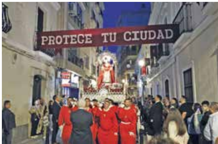
Procesión extraordinaria de santa Eulalia por las calles emeritenses.

gar los actos centrales de este encuentro con las proyecciones audiovisuales de las distintas manifestaciones de fe en torno a santa Eulalia que se llevan a cabo en las localidades participantes. A continuación, hubo una mesa redonda en la que varias