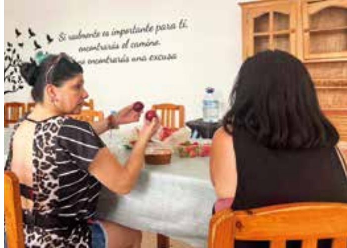
Personas atendidas en el centro de emergencia "Bravo Murillo", que Cáritas Diocesana tiene en Badajoz.

La falta de un techo obliga a estas personas a afrontar a diario una serie de obstáculos que impiden su integración plena en la sociedad. Entre ellas destacan la falta de intimidad, las dificultades de acceso a un trabajo decente y a una vivienda adecuada, las trabas para acceder a los trámites de la administración pública, como por ejemplo el empadronamiento, o los problemas de salud física y mental. "La salud mental merece especial atención, ya que es tanto un factor de riesgo como una consecuencia del sinhogarismo. Las crisis personales y las situaciones estresantes suelen ser detonantes que llevan a la persona a perder su hogar", indica Ma-