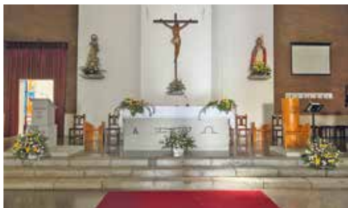
Parroquia San Gregorio Ostiense, en Montijo.

Parece ser que en Don Benito había un templo dedicado al mismo santo y allí se pi-