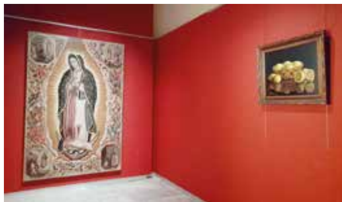
La Pieza Invitada se expone en la sala 12 del museo catedralicio.

La Pieza Invitada se expone en la Sala 12 del Museo de la Catedral, en la que cada mes se presentan dos obras de arte de artistas, épocas, técnica y temática muy diferente precedentes