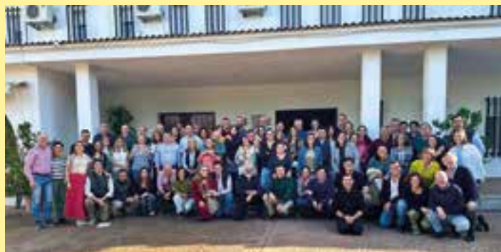
Proyecto Amor Conyugal llevó a cabo el pasado fin de semana un retiro en la casa de espiritualidad de Gévora