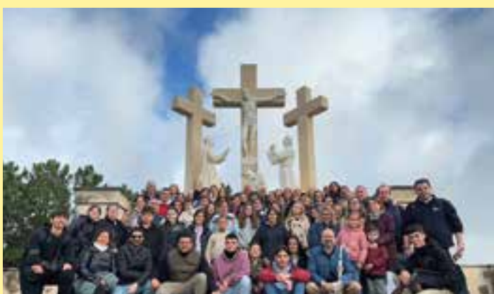
Alumnos y familias del Colegio Diocesano San Atón han peregrinado a Fátima, una actividad organizada por el 25 aniversario del Centro.