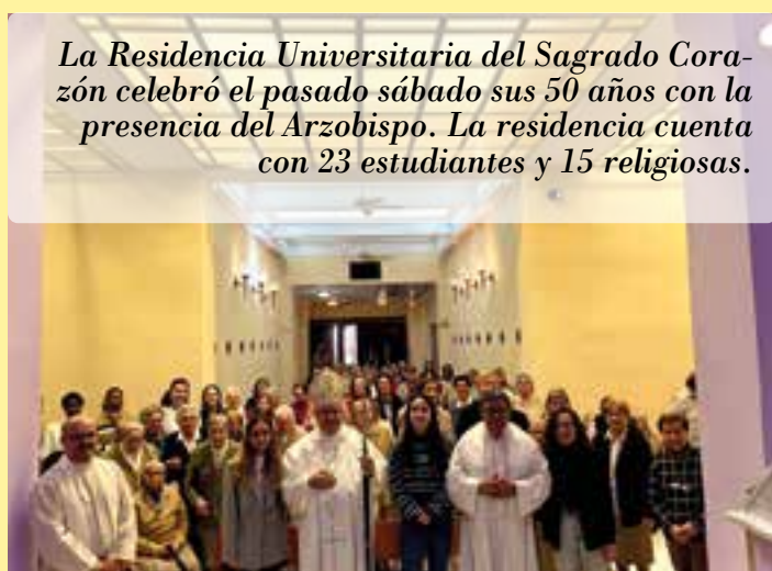
La Residencia Universitaria del Sagrado Corazón celebró el pasado sábado sus 50 años con la presencia del Arzobispo. La residencia cuenta con 23 estudiantes y 15 religiosas.