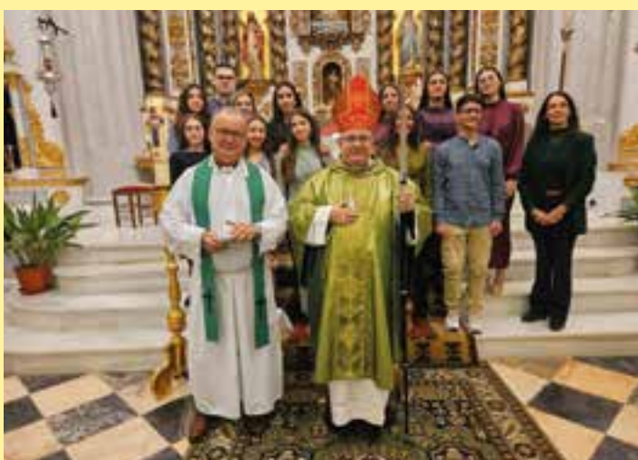
Don José Rodríguez Carballo ha confirmado a varios grupos de jóvenes durante esta última semana. El pasado sábado, día 9, fue en la parroquia de Cheles (foto izda.). Al día siguiente confirmó a otro grupo de jóvenes en la localidad de Aljucén