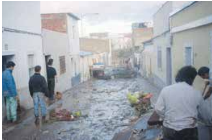
Los voluntarios se volcaron con los vecinos del Cerro de Reyes.