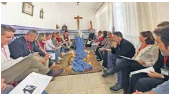
Momento de oración en uno de los encuentros.

Los Equipos de Nuestra Señora (ENS) están llevando a cabo una serie de encuentros para matrimonios, “ESCAPADA XA3”, que se están desarrollando en diferentes localidades de la Diócesis con el propósito de fortalecer los lazos conyugales y espirituales de las parejas partici-