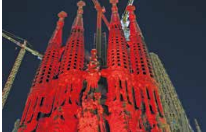
La Sagrada Familia, en Barcelona, se iluminó de rojo.

La fundación pontificia Ayuda a la Iglesia Necesitada (AIN) viene celebrando del 18 al 24 de noviembre la REDWEEK, una semana de concienciación, información y oración por los cristianos perseguidos