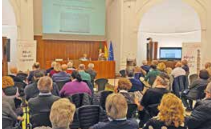
Inauguración del Congreso Internacional.