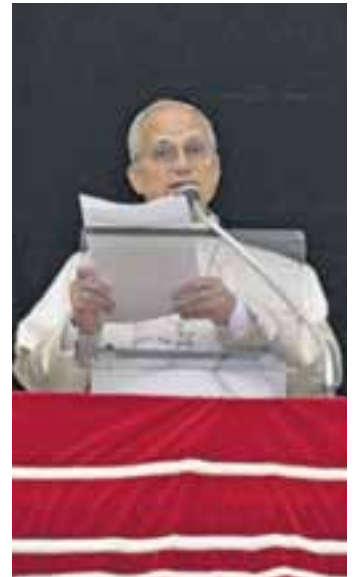
Papa León XIV, en el Ángelus dominical.

En realidad, no necesitamos estos “sucedáneos de la felicidad”, observa el Papa León, porque “nuestra alegría y nuestra grandeza se