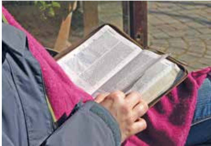
Llevar la Palabra de Dios contigo favorece su lectura diaria.

Es fundamental que las comunidades eclesiales se empeñen en la formación