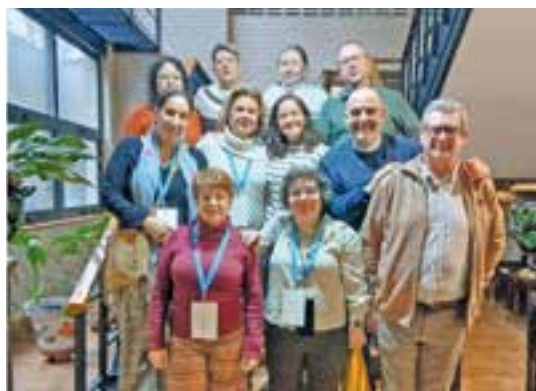
Participantes de nuestra archidiócesis.

Más de 400 responsables del Movimiento de Cursillos de Cristiandad, procedentes de 36 diócesis españolas, entre ellas la Archidiócesis de Mérida-Badajoz, se dieron cita del 30 de enero al 1 de febrero, en el IX Encuentro Nacional de Responsables de Cursillos de Cristiandad,