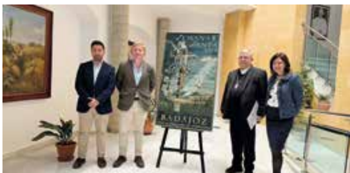
Concejala, alcalde, arzobispo y representante cofrade junto al cartel

El nuevo capellán tendrá entre sus funciones la atención pastoral de toreros, ganaderos y trabajadores de las plazas y el acompañamiento espiritual a las personas vinculadas a este ámbito. El decreto señala también que deberá ejercer su ministerio en comunión con los párrocos y rendir cuentas de su labor al inicio y final de cada curso pastoral.