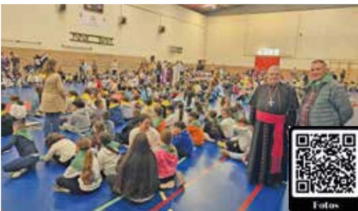
El Arzobispo asistió al encuentro.

La jornada concluyó con la celebración de la Eucaristía y un posterior momento de convivencia entre los asistentes, acompañado de un refresco en honor a las personas homenajeadas.