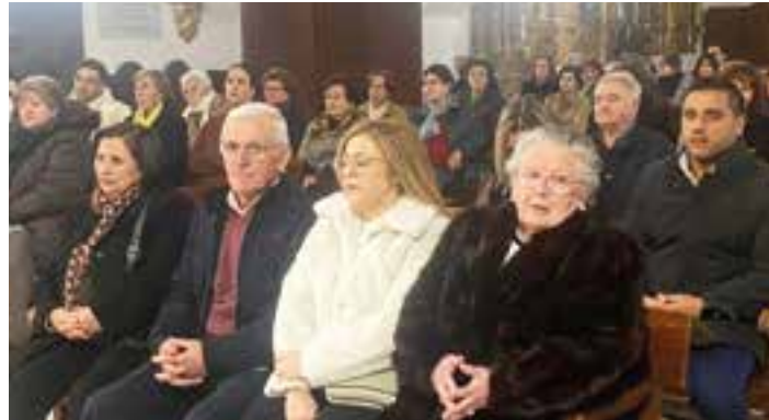
Participantes en la Asamblea parroquial.

La Asamblea fue preparada previamente por el Consejo de Pastoral Parroquial, que llevó a cabo un proceso de análisis de la realidad del pueblo y del grado de implicación de los vecinos en la vida parroquial, siguiendo un itinerario de carácter sinodal. Como parte de este trabajo, los miembros del Consejo realizaron visitas domiciliarias para entregar un cuestionario dirigido a personas mayores de dieciséis años. En total se recogieron más de 260 respuestas, lo que supone un 55 % de las encuestas distribuidas.