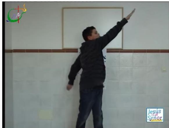
#m Pascua (Resurrección). Canción con gestos para niños, letra y acordes, de Fermín Negre (Ixcís)