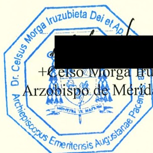
+ Celsus Morga Iruzubieta Arzobispo de Mérida-Badajoz

Dado en Badajoz, a 1 de junio de 2023, fiesta de Nuestro Señor Jesucristo, Sumo y Eterno Sacerdote.